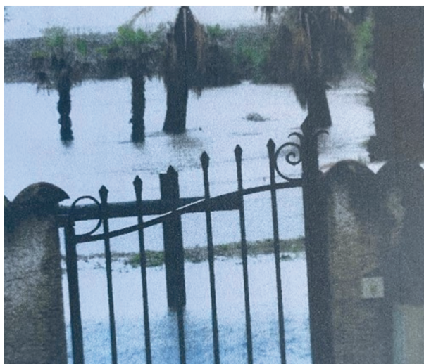
CHEMIN DU CHAMP JUVÉNAL, 2014

La ville s'est dotée en 2007 d'un « schéma directeur d'assainissement des eaux pluviales », mais ses conclusions n'ont été réalisées que partiellement. Les maisons et immeubles dans le large secteur s'étendant du chemin du Champ Juvénal jusqu'à l'avenue de l'Europe sont régulièrement inondés.