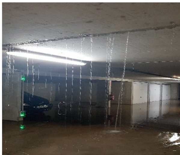
AVENUE DE L'EUROPE, 2022